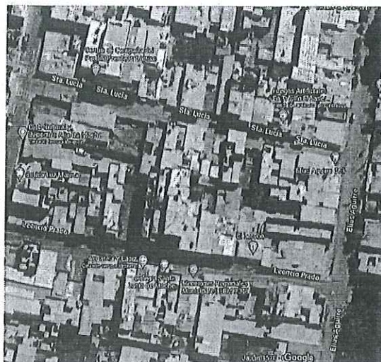
FIGURA N° 1 UBICACIÓN DEL PROYECTO

Actualmente la zona a intervenir para la construcción del proyecto denominado "MEJORAMIENTO Y AMPLIACION DEL SERVICIO DE ATENCION INTEGRAL AL ADULTO MAYOR EN CIAM DE LA MUNICIPALIDAD DISTRITAL DE MOCHE DEL DISTRITO DE MOCHE DE LA PROVINCIA DE TRUJILLO DEL DEPARTAMENTO DE LA LIBERTAD", presenta algunos muros producto de demoliciones de la estructura anterior ubicada en el terreno, además del desmonte correspondiente. El terreno en cuestión está en una zona urbana en la cual se cuenta con todos los servicios públicos, como lo son acceso a luz, agua y desagüe, además de encontrarse en zona de cobertura para empresas que brindan servicio de internet.