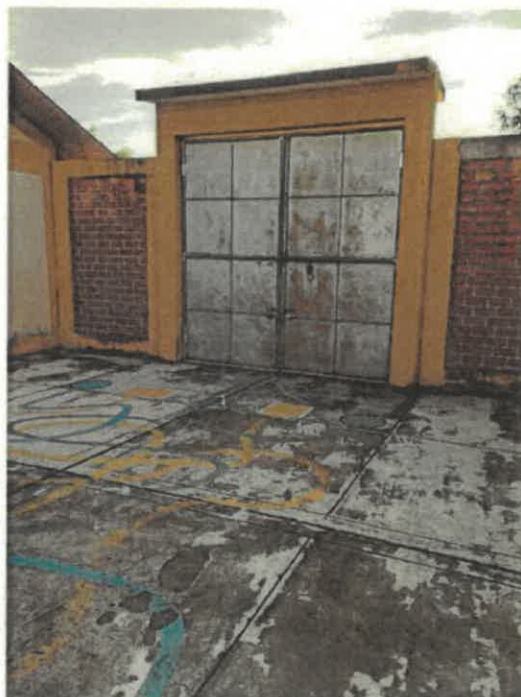
VISTAS DE LA SITUACION ACTUAL DE LA INSTITUCION EDUCATIVA