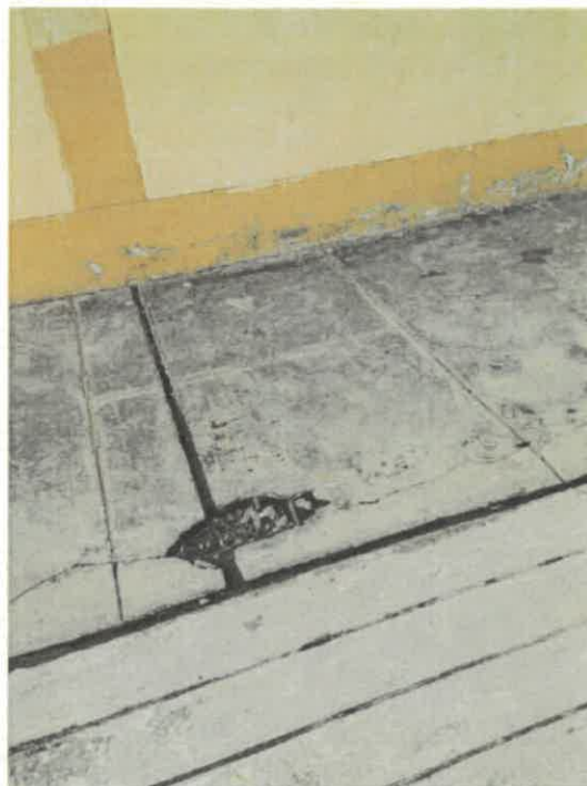
VISTAS DE LA SITUACION ACTUAL DE LA INSTITUCION EDUCATIVA