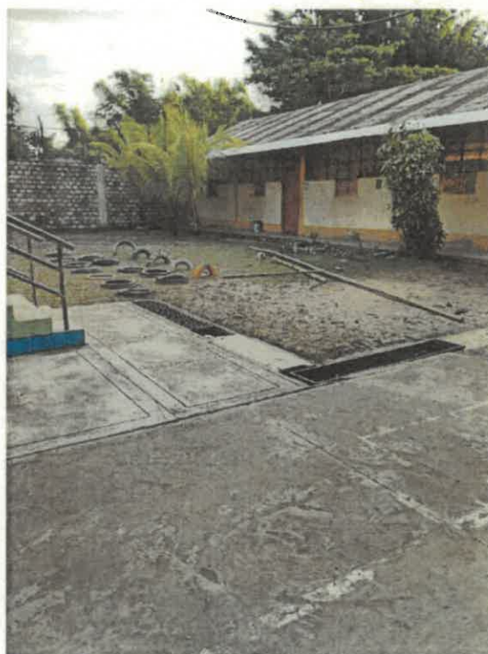
VISTAS DE LA SITUACION ACTUAL DE LA INSTITUCION EDUCATIVA