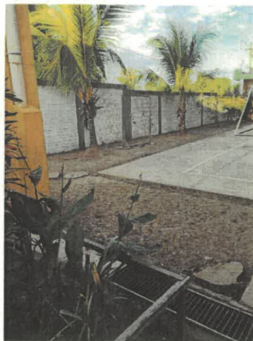
VISTAS DE LA SITUACION ACTUAL DE LA INSTITUCION EDUCATIVA