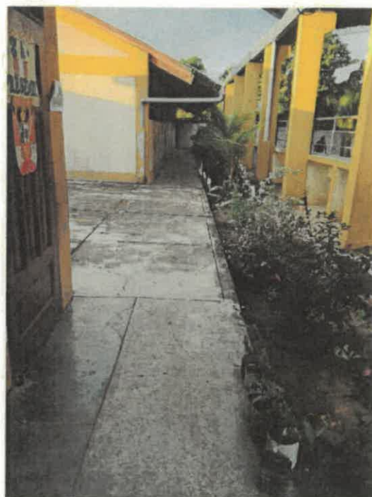
VISTAS DE LA SITUACION ACTUAL DE LA INSTITUCION EDUCATIVA