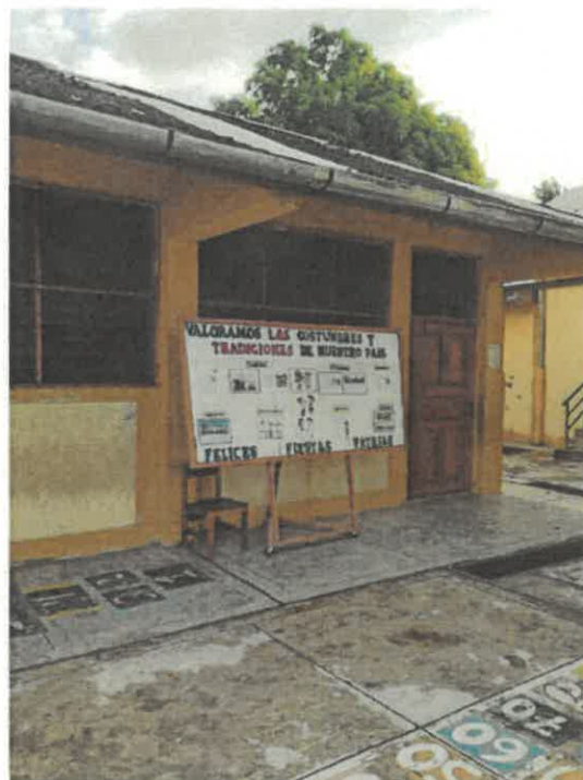
VISTAS DE LA SITUACION ACTUAL DE LA INSTITUCION EDUCATIVA