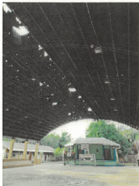
VISTAS DE LA SITUACION ACTUAL DE LA INSTITUCION EDUCATIVA