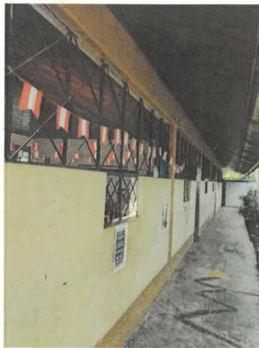
VISTAS DE LA SITUACION ACTUAL DE LA INSTITUCION EDUCATIVA