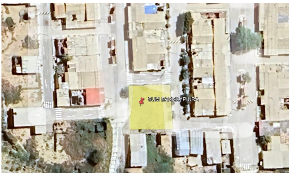
Ilustración 2. Ubicación del proyecto