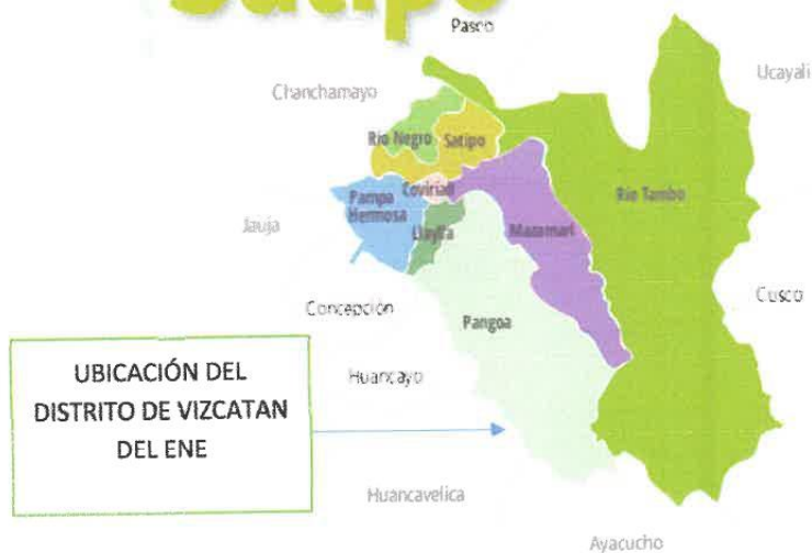
GRAFICO N°04: LOCAL