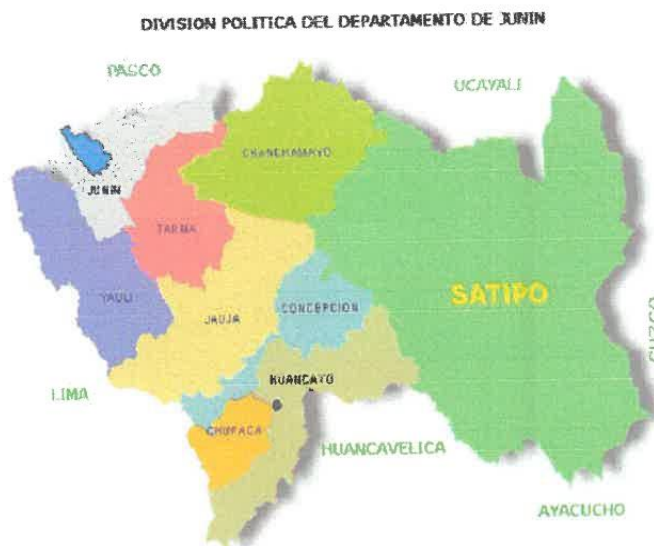
GRAFICO N°03: PROVINCIAL