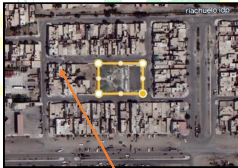
Micro Localización (Distrito Nuevo Chimbote – H.U.P. CALIFORNIA)