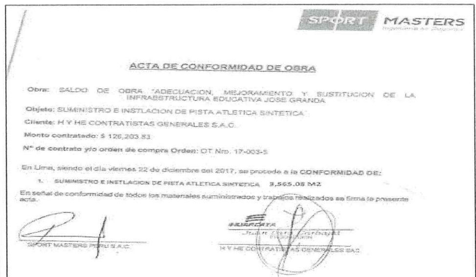
IMAGEN N° 02

Asimismo, la incongruencia del documento es evidente, puesto que la conformidad no puede ser otorgada por el propio vendedor , sino debe hacerlo el comprador dado que ha sido este el acreedor de la prestación.