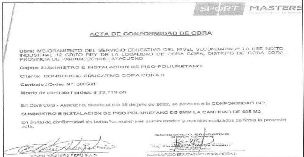
IMAGEN N° 07

Asimismo, la incongruencia del documento es evidente, puesto que la conformidad no puede ser otorgada por el propio vendedor , sino debe hacerlo el comprador dado que ha sido este el acreedor de la prestación.