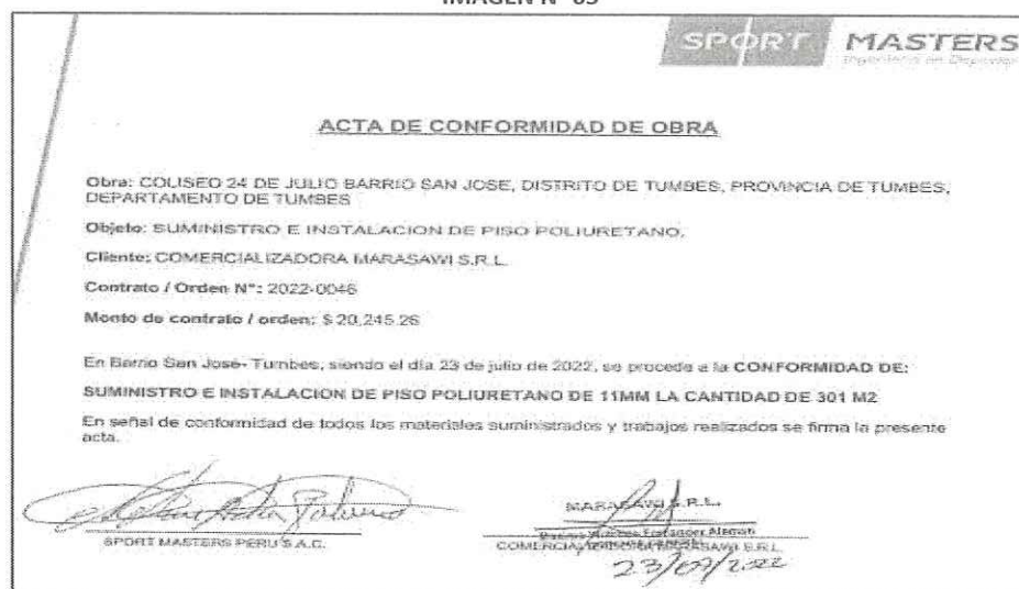
IMAGEN N° 05

Asimismo, la incongruencia del documento es evidente, puesto que la conformidad no puede ser otorgada por el propio vendedor , sino debe hacerlo el comprador dado que ha sido este el acreedor de la prestación.