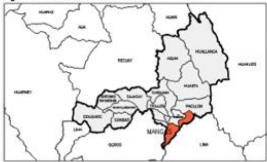
Figura 1-2 Localización Distrital