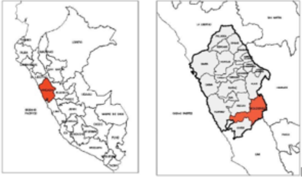
Figura 1-1 Localización Departamental y Provincial