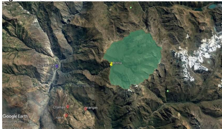
Figura 1-4 Ubicación de la microcuenca en estudio