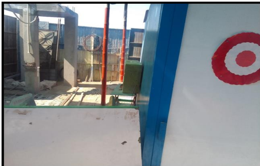
Vista de la parte interior del centro educativo inicial N° 281.