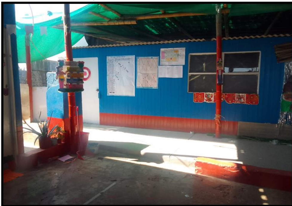
Vista de la parte interior del centro educativo inicial N° 281.