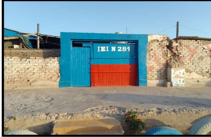
Vista de la puerta de ingreso de la institución educativa inicial 281.

la institución educativa de nivel inicial cuenta con un área de 1,610.80 m2 las cuales serán construidas en su totalidad.