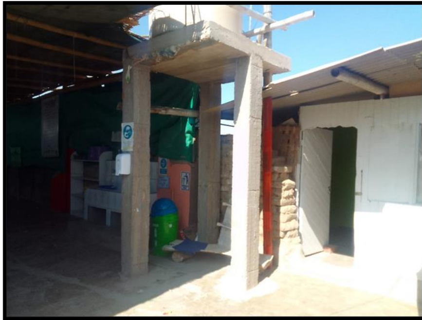
Vista de la parte interior del centro educativo inicial N° 281.