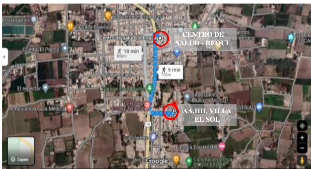
Imagen 3: Ruta de acceso al área del proyecto