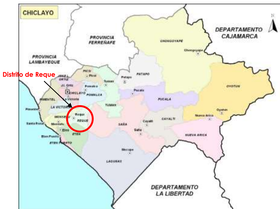
PROVINCIA DE CHICLAYO Y DISTRITO DE REQUE