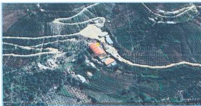
Imagen 1: SE OBSERVA EL CENTRO POBLADO DE ANTA

En la figura se muestra la localidad de Anta del distrito de Moro.