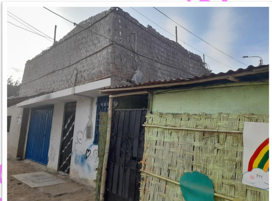
Figura N°5: Situación actual de la I.E Caritas Felices