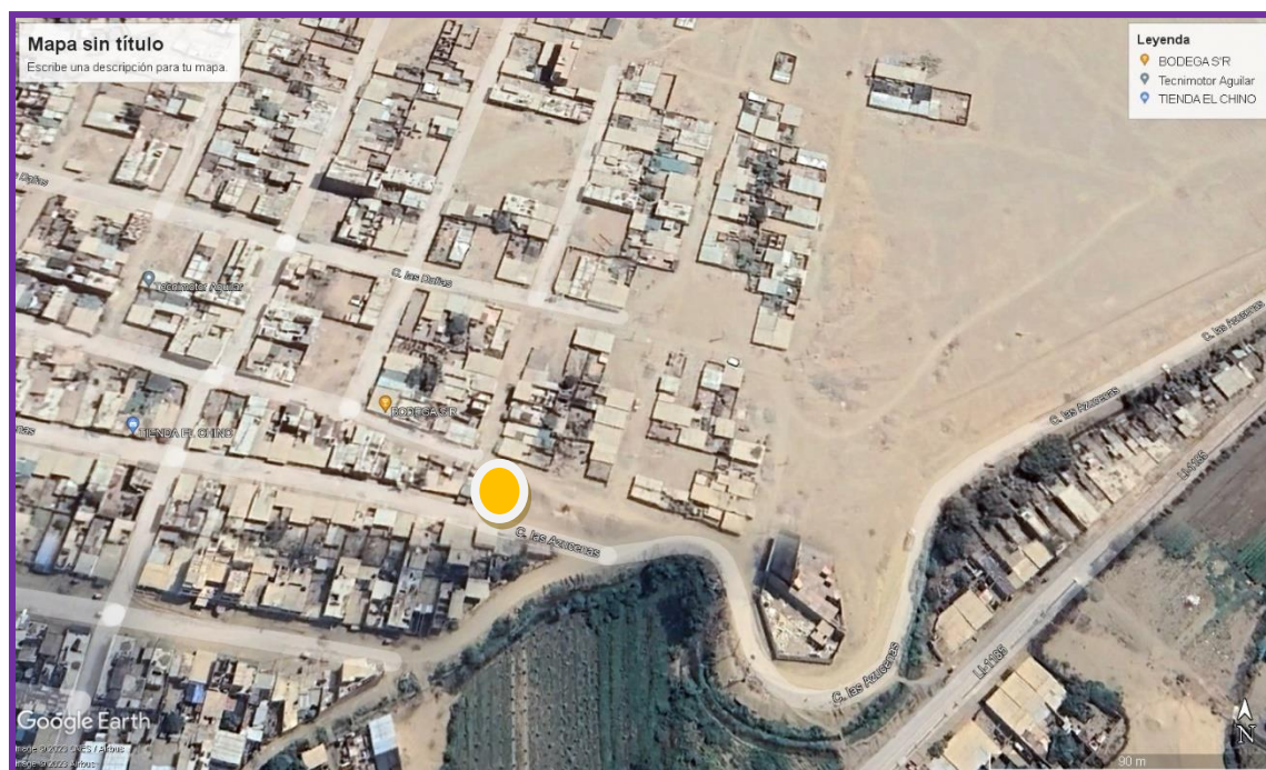
Figura N° 3: Esquema de Ubicación General