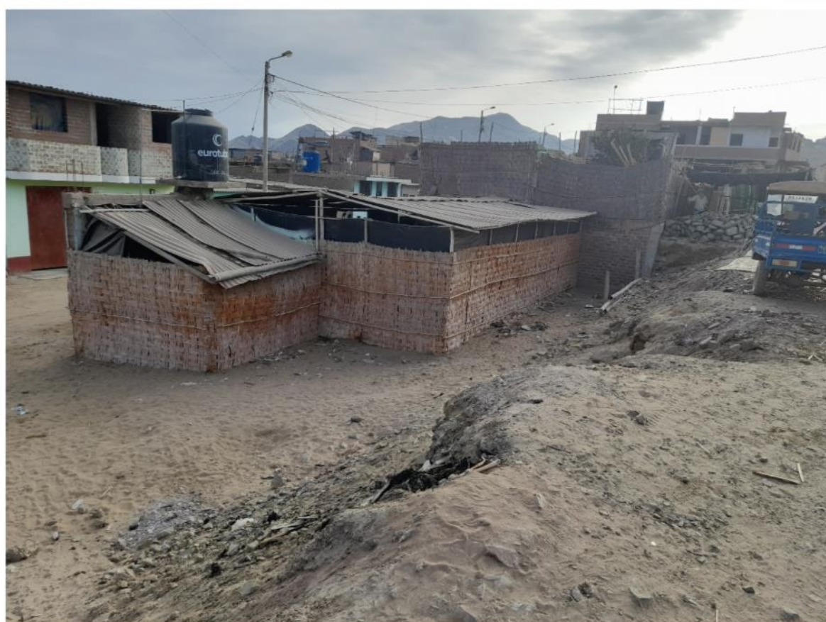
Figura N°7: Se puede ver el desnivel entre el área del proyecto y la calle Las Gardenias