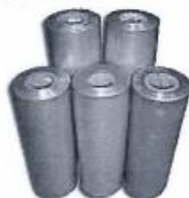
IMAGEN DE REFERENCIAL