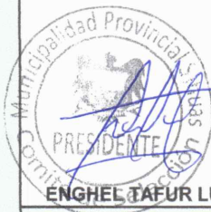
ENGHEL TAFUR LUCERO