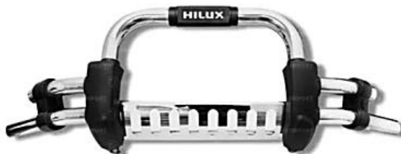
Figura referencial defensa delantera