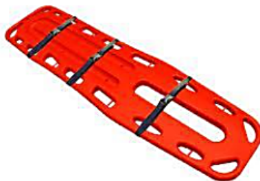
Figura referencial de camilla