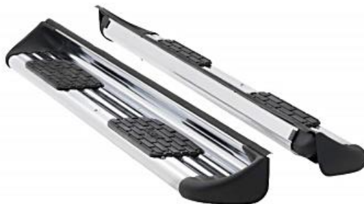
Figura: estribos laterales es referencial