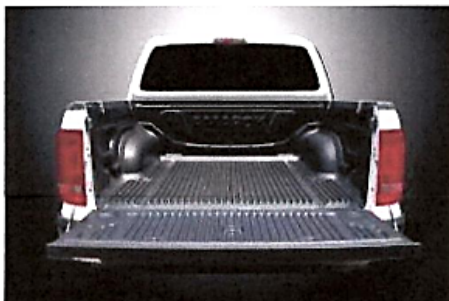
Figura referencial de protector de tolva