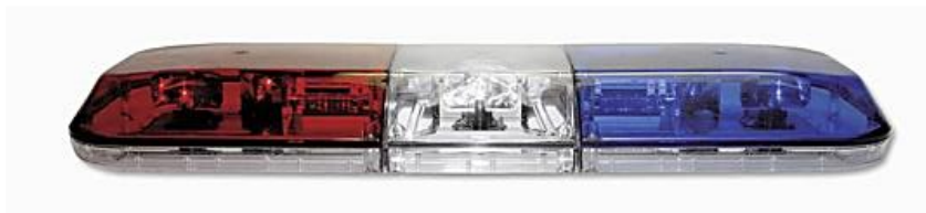
Figura: Barra de luces referencial