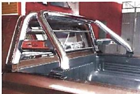
Figura referencial de sistema antivuelco