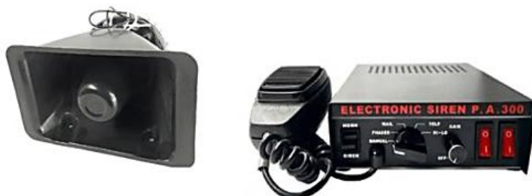
Figura: Sirena con alta voz referencial