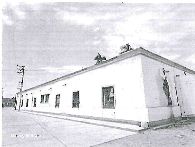
Fotografía N°01: Cobertura de techo en mal estado.

A continuación, se presenta una muestra fotográfica del estado situacional de la infraestructura el Establecimiento de Salud.