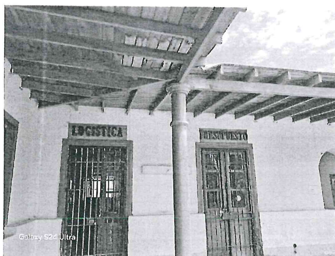
Fotografía N°06: Cobertura de techo en mal estado