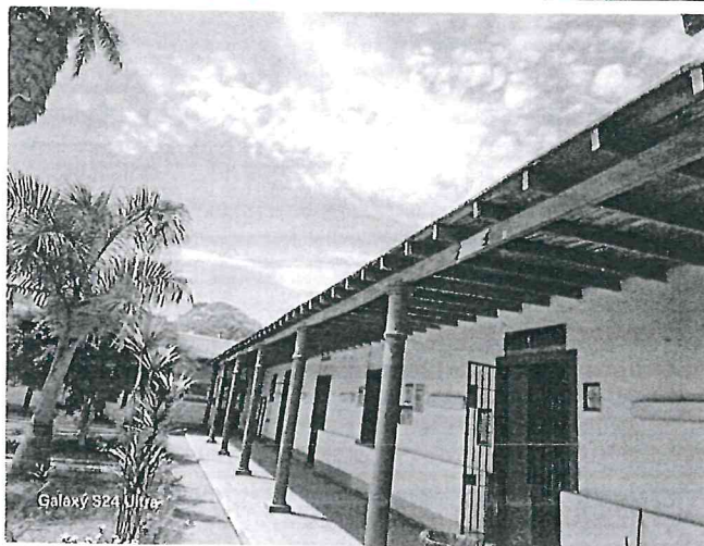
Fotografía N°07: Cobertura de techo en mal estado

" Año del Bicentenario, de la consolidación de nuestra Independencia, y de la conmemoración de las heroicas batallas de Junín y Ayacucho "