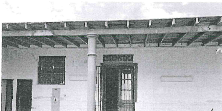
Fotografía N°02: Cobertura de techo en mal estado.

[Handwritten signature] GERENCIA REGIONAL DE SALUD RED DE SALUD PACASMAYO