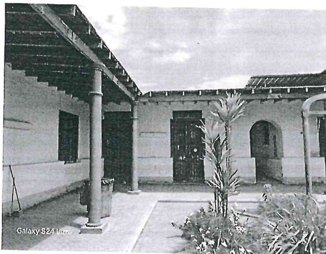
Fotografía N°03: Cobertura de techo en mal estado.

"Año del Bicentenario, de la consolidación de nuestra Independencia, y de la conmemoración de las heroicas batallas de Junín y Ayacucho"