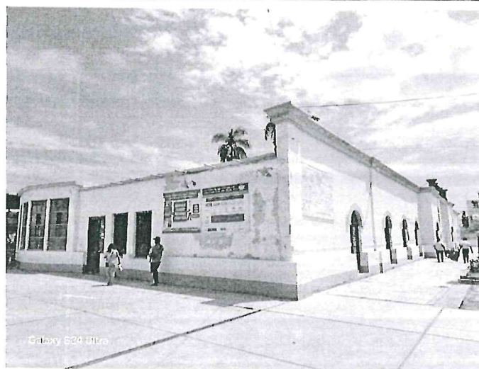
Fotografía N°05: Cobertura de techo en mal estado

" Año del Bicentenario, de la consolidación de nuestra Independencia, y de la conmemoración de las heroicas batallas de Junín y Ayacucho "