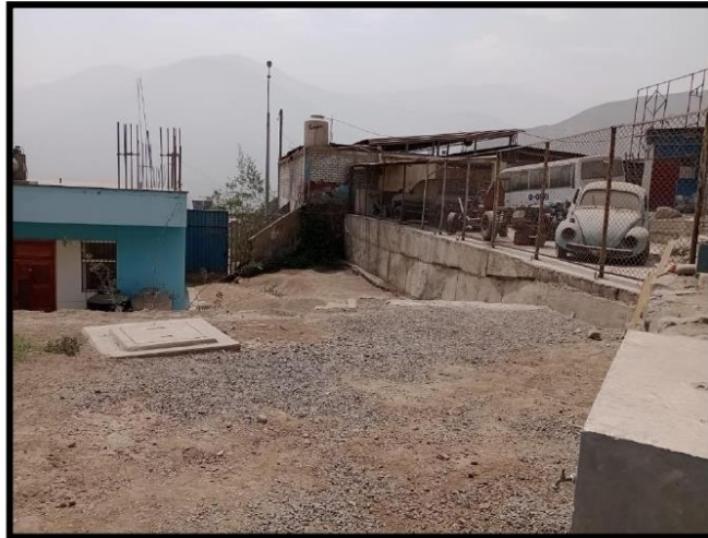
Fotografía N°01.- Desde esta ubicación, se visualiza el inicio de la instalación de la rampa 1 diseñada para facilitar el acceso a personas con discapacidad al pabellón inferior.