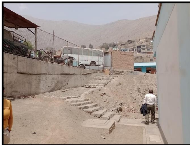
Fotografía N°02.- Desde esta ubicación, se visualiza el punto de llegada de la instalación de la rampa 1 diseñada para facilitar el acceso a personas con discapacidad.