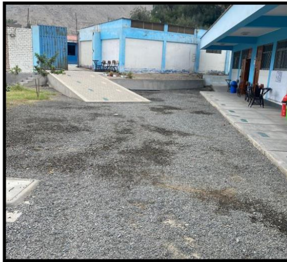
Fotografía N°03.- Desde esta ubicación se puede observar la futura modificación de la rampa, al no cumplir con la pendiente requerida para una rampa que facilite el acceso a personas con discapacidad.

Oficina de Gestión de la Educación Superior