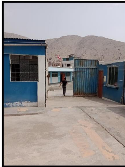
Fotografía N°05.- Desde esta ubicación se puede observar 01 de las 03 futuras rampas que facilitará el acceso a personas con discapacidad.

Oficina de Gestión de la Educación Superior