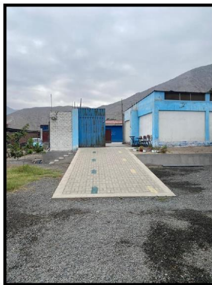
Fotografía N°04.- Desde esta ubicación, se visualiza la futura instalación de una rampa diseñada para facilitar el acceso a personas con discapacidad.