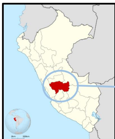
Fig. 1: Ubicación de la región