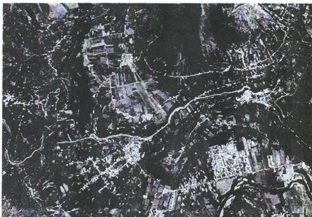
Fotografía N°01: El Sector de la localidad de tinco.