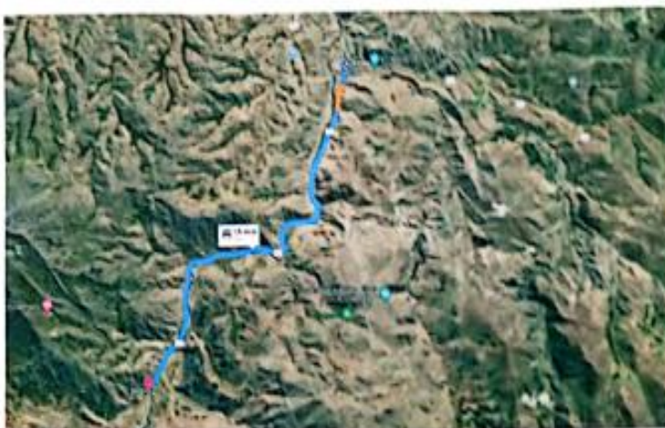
Imagen: Ubicación del Proyecto.