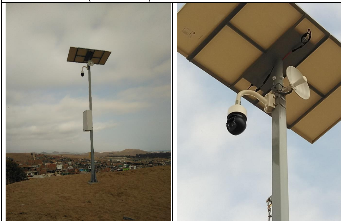
Puesto de Vigilancia PV N° 03 (techo)