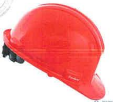
CASO DE SEGURIDAD