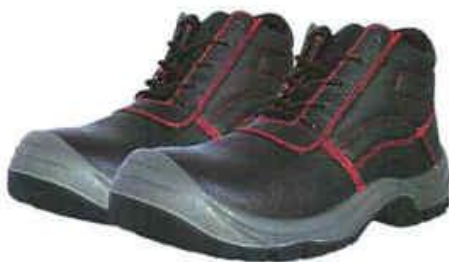
ZAPATOS DE SEGURIDAD TRABAJO – SEGURIDAD

INSTITUTO DE VIALIDAD MUNICIPAL DE LA PROVINCIA DE CAJABAMBA AÑO 2024