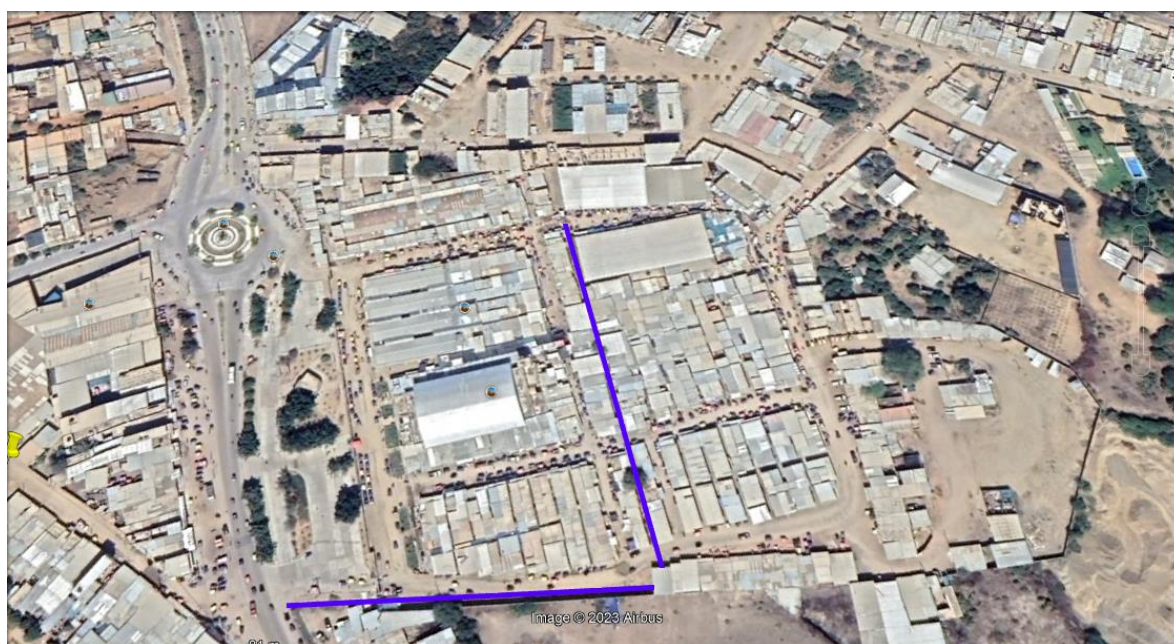
Foto 02: Vista en Planta de Ubicación de Drenes de Mercado de Tambogrande.