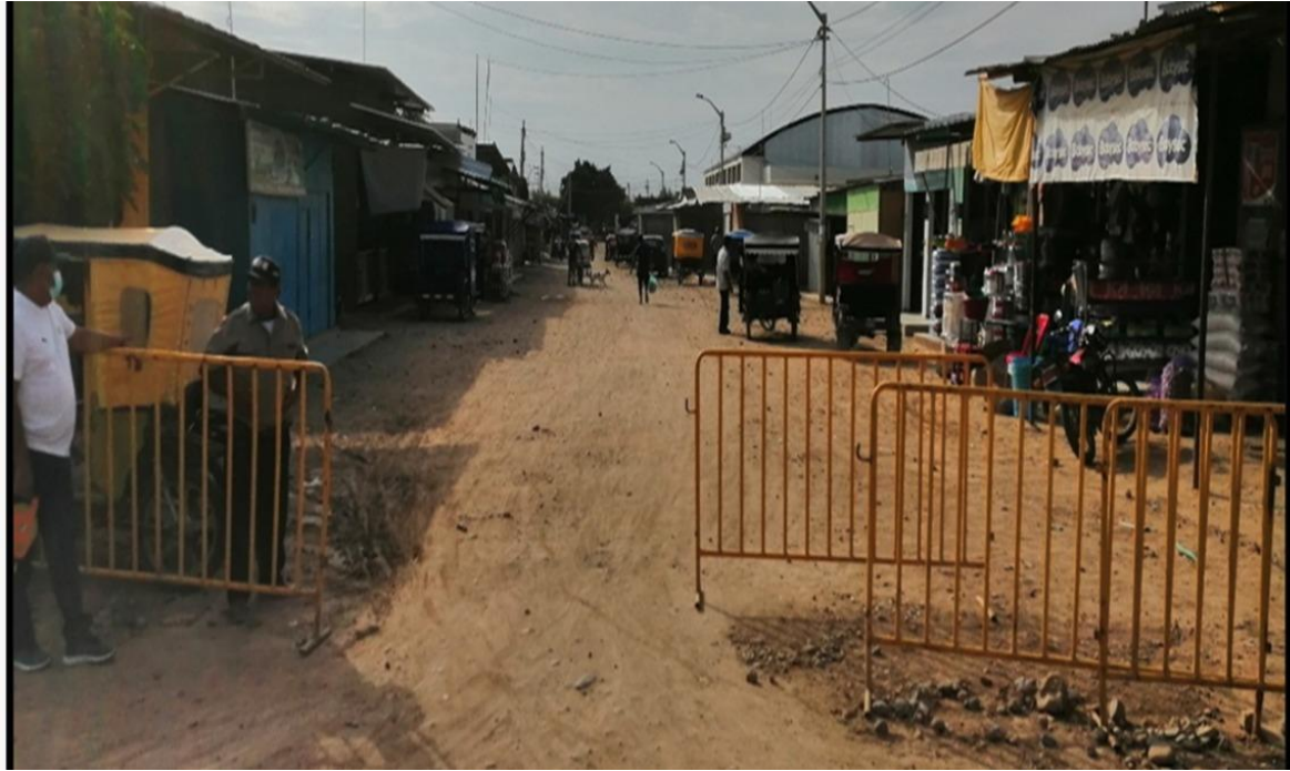
Foto 03: En esta fotografía se observa que la vía necesita una capa de material granular para evitar el bacheo.