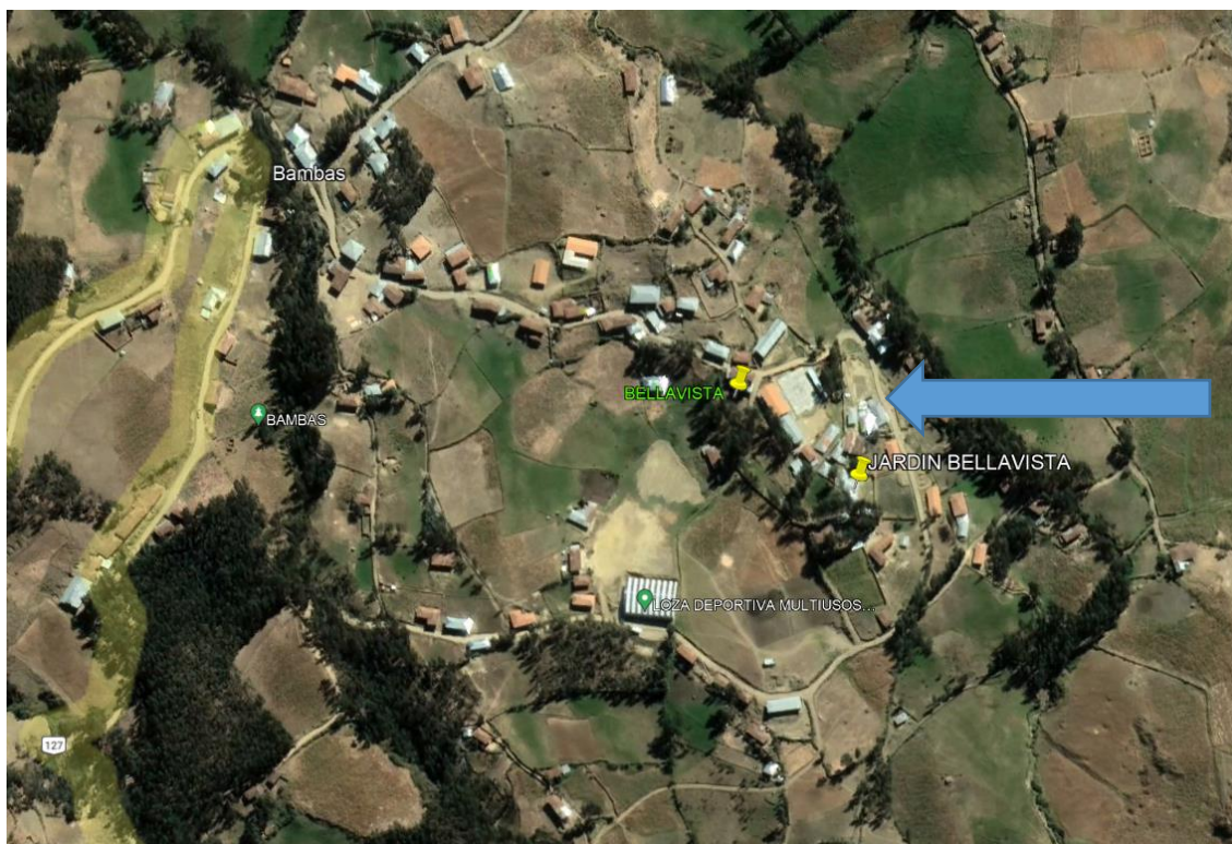
Ubicación Geográfica del lugar donde se proyecta la edificación.

Imagen N° 1: Ubicación y localización (9°09'22.25.00 N, 226°06'09.00 E)