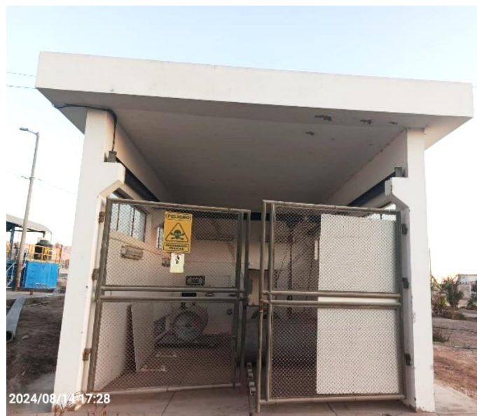
INTERIOR DE LA CASETA