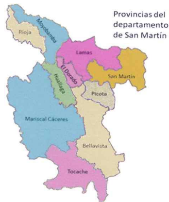
PROVINCIA DE MARISCAL CACERES