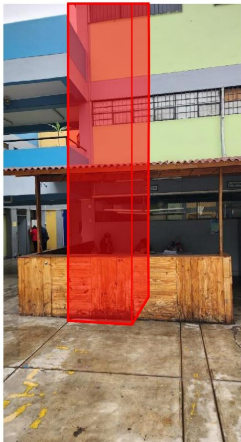
IMAGEN N° 01: Área donde se proyecta la ubicación del elevador para personas con discapacidad.