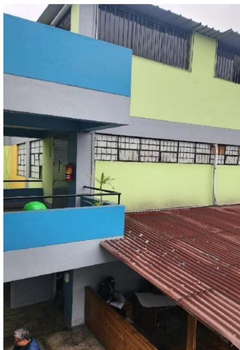
IMAGEN N° 03: Desmontaje de estructura de madera y cobertura ligera.