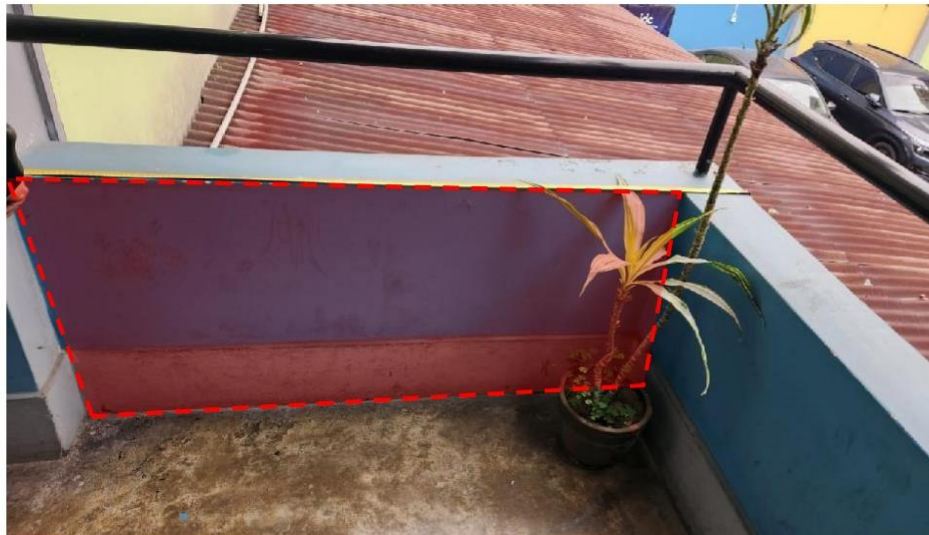
IMAGEN N° 02: Se observa el área de demolición y/o corte de parapetos para generar acceso al elevador para personas con discapacidad.