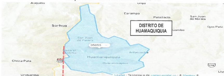
Mapa N°2: Micro Localización del PIP

Creado el 02 de junio de 1936 – Ley N° 8298