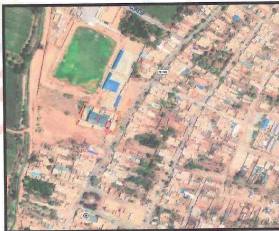
Imagen 01: Localización del proyecto.