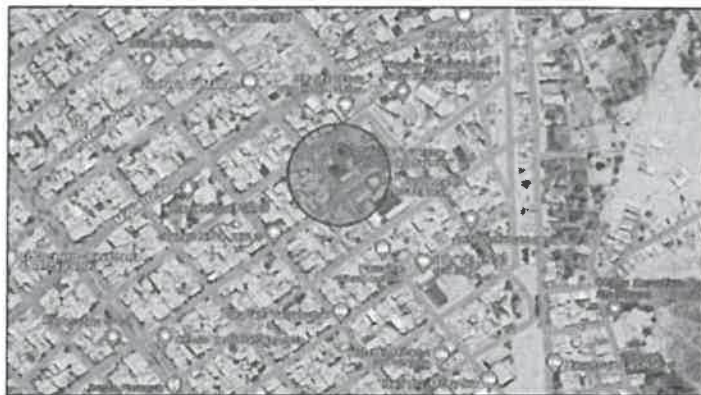
Ubicación del Centro de Educación Técnico Productiva “Nuestra Señora del Carmen – distrito de Parcona, Ica.

El centro de Educación Técnico Productiva – “Nuestra Señora del Carmen”, se encuentra ubicado en el centro poblado de Parcona (primera etapa) MZ D6 LOTE 1, distrito de Parcona, provincia de Ica, departamento de Ica, cuyo terreno se encuentra inscrito en los registros públicos a favor del Ministerio de Educación en la partida NºP07009575, con un área de 5,487.6100 m 2 y un perímetro de 303.85 Ml.