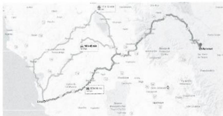
GRAFICO N° 04 TRAMO LIMA - MAZAMARI