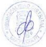
CUADRO N° 04

Aspectos Económicos la actividad económica predominante de la provincia es la agricultura. Los principales cultivos son: el café, cacao, cítricos, piña, achiote, plátano, maíz, arroz, yuca y papa para el mercado. Otras actividades importantes son el comercio, la prestación de servicios y el turismo. La actividad agropecuaria está concentrada mayormente en las áreas de mayor densidad vial. La actividad pecuaria en el distrito de Mazamari, es complementaria a la agricultura, básicamente en el aprovechamiento de los pastos naturales que sustenta una ganadería que comprende ganado vacuno y porcino. En la producción pecuaria, el 10% se destina para el autoconsumo y el 90% para la comercialización en los mercados locales. La actividad pecuaria en Mazamari comprende en primer término el ganado vacuno, que se desarrolla en el ámbito provincial, le sigue la crianza de ganado ovino en las partes altas, porcino, aves, y animales menores. Vivienda y Servicios Públicos: a) Población El área afectada por la deficiente infraestructura sanitaria corresponde en principio a la Comunidad Nativa de Tsiriari. En conjunto conforman una población de 674 habitantes. En el siguiente cuadro observemos el hecho: