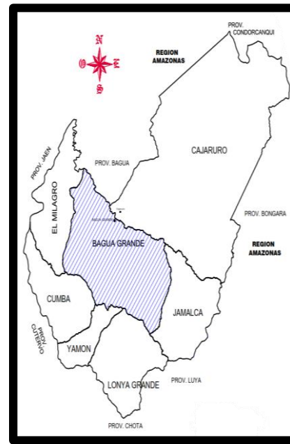
Provincia de Utcubamba