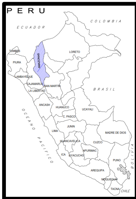
Mapa del Perú