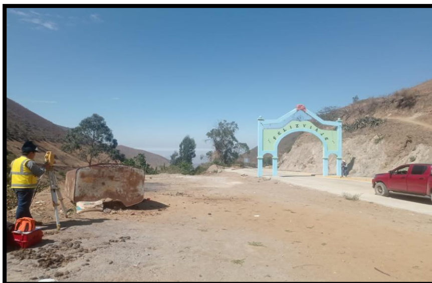
IMAGEN 7- VISTA PANORAMICA DEL TERRENO DEL PROYECTO

Ante esta problemática y con el objetivo de mejorar y aliviar el déficit de espacios de recreación activa y pasiva, y de esta manera brindar un espacio acorde a las necesidades de la población de la localidad de La Cuesta; se pondrá en valor la Creación de los Servicios Públicos de Integración Económica y Social en la Alameda de Centro Poblado la Cuesta distrito de La Cuesta de la Provincia de Otuzco del Departamento de la Libertad - CUI N°2596213, con la finalidad de cumplir con el objetivo planteado con este proyecto.