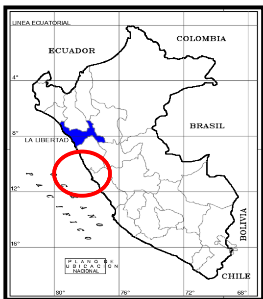
Fuente: Estudio topografico IMAGEN 2 MAPA DEL PERU