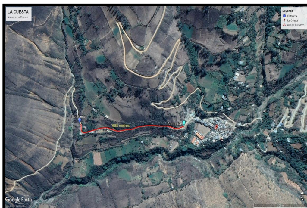
IMAGEN 6 - UBICACIÓN DEL CENTRO DE ACOPIO-BOTADERO

El centro de acopio o botadero propuesto, cumple con las características para ser utilizado como tal, considerando que debe estar en las cercanías al proyecto, así como tener una fácil accesibilidad y tener las condiciones topográficas para cumplir dicha función; para fines de uso se debe realizar las coordinaciones respectivas con las autoridades pertinentes o responsables pertinentes.