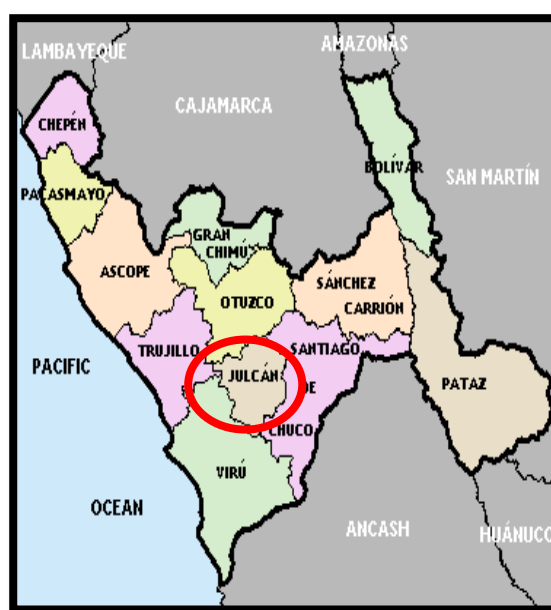
IMAGEN 1 DEPARTAMENTO DE LA LIBERTAD