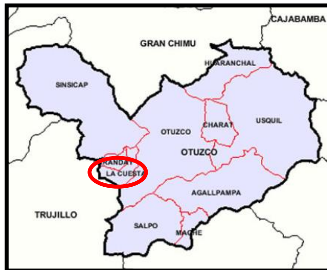
Fuente: Estudio topografico IMAGEN 3 PROVINCIA DE OTUZCO