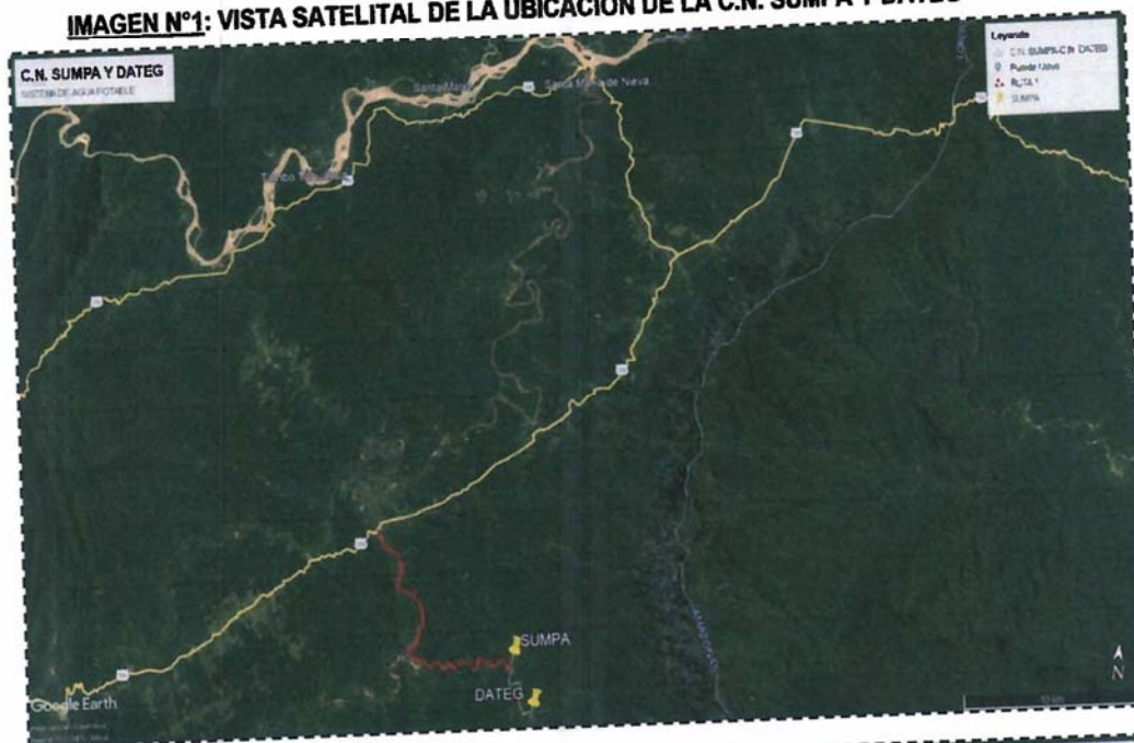
IMAGEN N°1: VISTA SATELITAL DE LA UBICACIÓN DE LA C.N. SUMP Y DATEG

"Año del Bicentenario, de la consolidación de nuestra Independencia, y de la conmemoración de las heroicas batallas de Junín y Ayacucho"