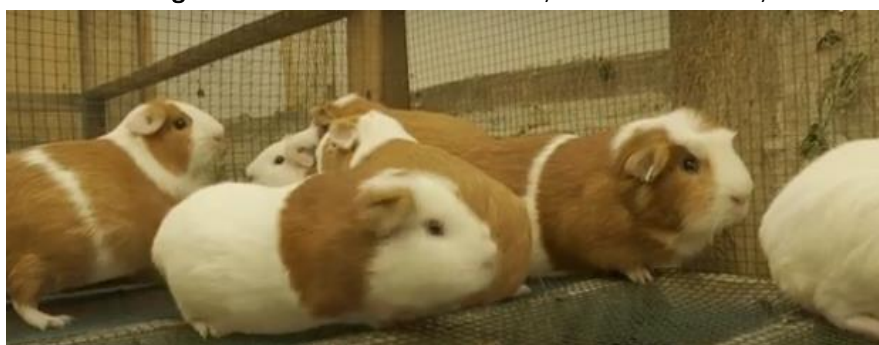
Imagen 1. Crianza semi tecnificada y sostenible del cuy

El tamaño del proyecto está en función al número de personas que recibirán el servicio de apoyo al desarrollo productivo en la crianza de cuyes, que según el diagnóstico se identificó a 900 productores que no reciben dicho servicio. En base al número de personas se define los componentes que tendrá el proyecto, así como la meta por cada acción a fin de que dichos productores reciban un servicio eficiente. A continuación, describimos las metas por cada componente: