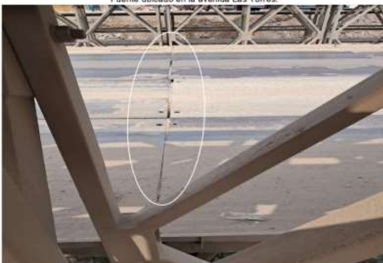
Imagen 02.- Desalineamiento de Plataformas.