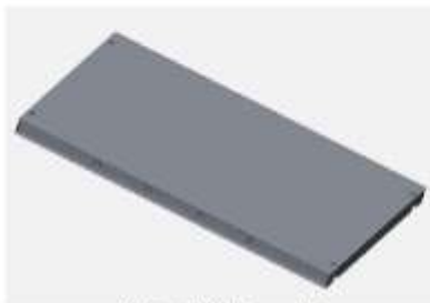
Gráfico 01: Cubierta central

La unidad de medida de la presente actividad es la unidad (und).