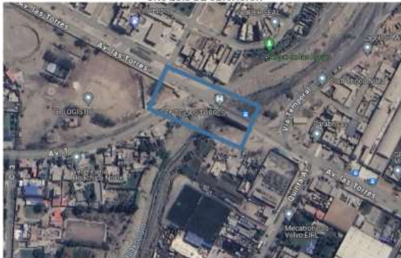
Figura 1: Ubicación del Puente vehicular "TUMI" Coordenadas WGS84: -12.00259223644985, -76.91896479204522