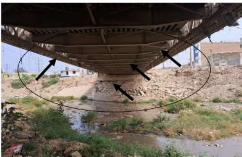
Imagen 01.- Resquebrajamiento de viga tipo H metálica. Puente ubicado en la avenida Las Torres.

Puente ubicado en la avenida Las Torres.