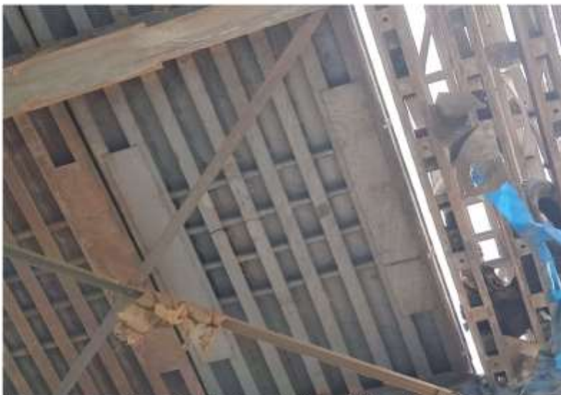
Imagen 03.- Viguetas quebradas en plataforma lateral