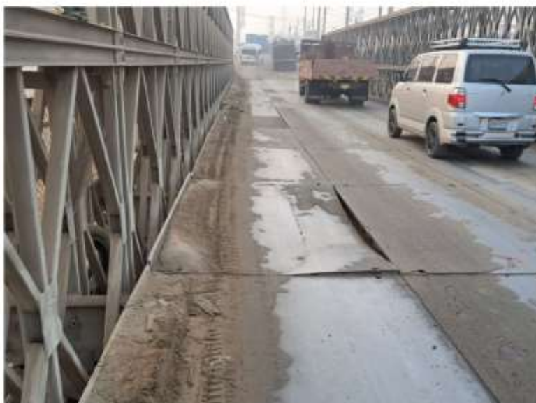
Imagen 04.- Plataformas colapsadas