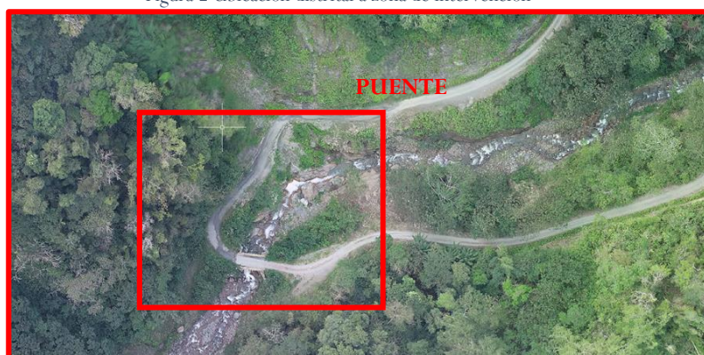
Figura 3 Ubicación del proyecto