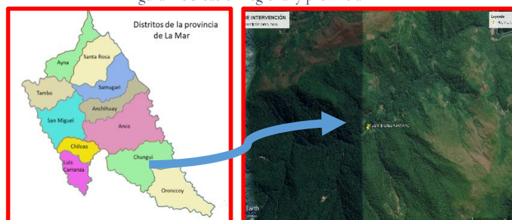
Figura 2 Ubicación distrital a zona de intervención