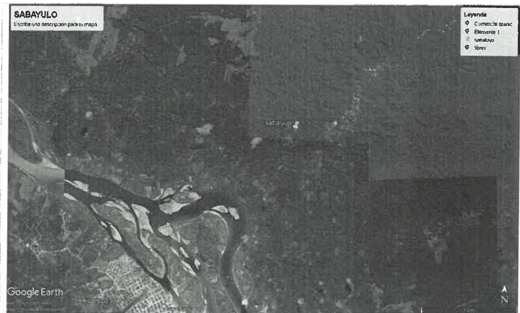
Figura 2: Vista satelital de la Comunidad Nativa SABALUYO.