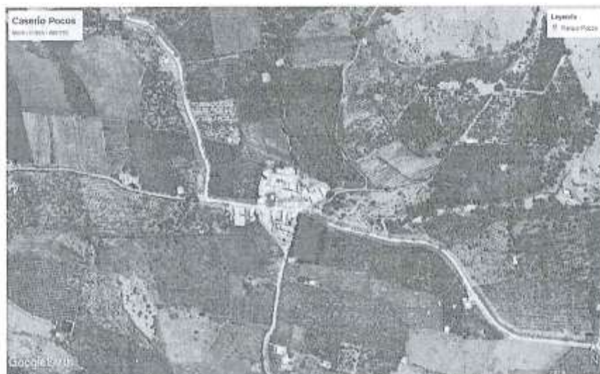
Vista del Área de Intervención del Proyecto