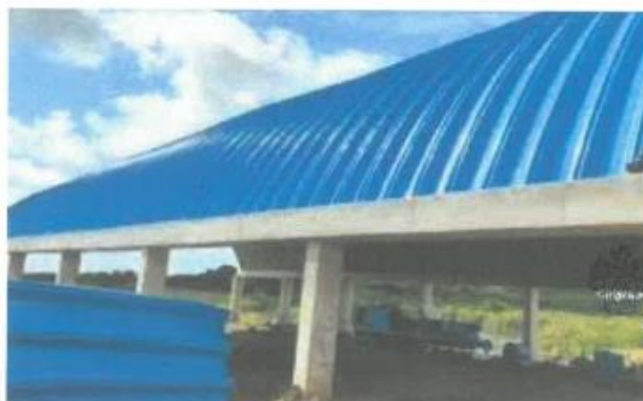
Imagen 1 COBERTURA REFERENCIAL PARA INSTALACIÓN.