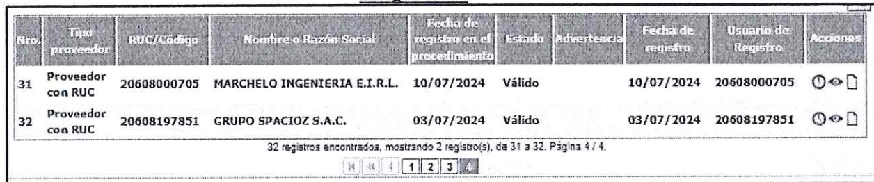
Imagen N° 01

El procedimiento de selección contó con el registro de treinta y dos (31) participantes, según se detalla en la página final de Registro del SEACE: