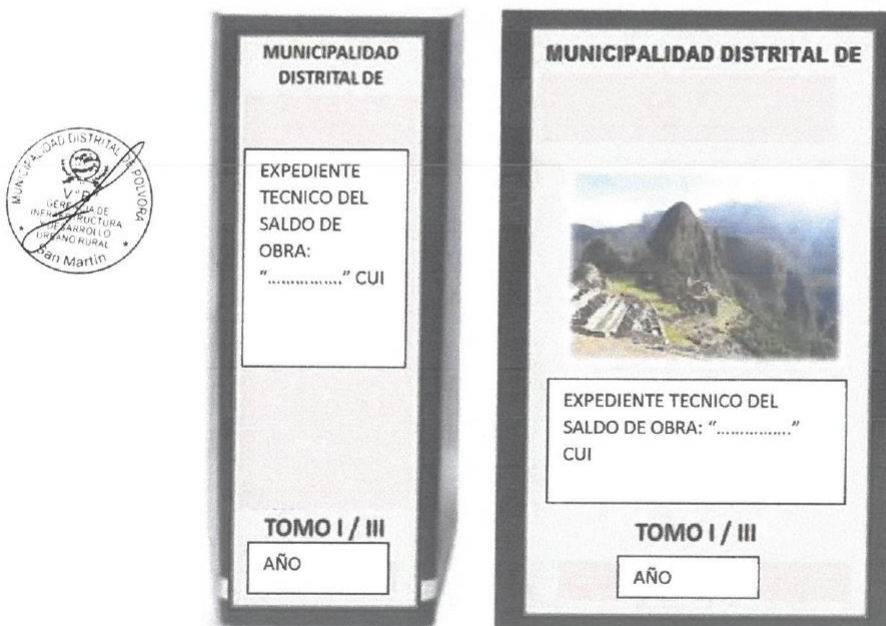
Figura 1. Forma de presentación del Expediente (ejemplo)

Nota. - Cada uno de los documentos que conforman el Expediente Técnico, deberá estar firmado por el Ingeniero jefe de Proyecto y los Ingenieros Especialistas responsable de su ejecución.