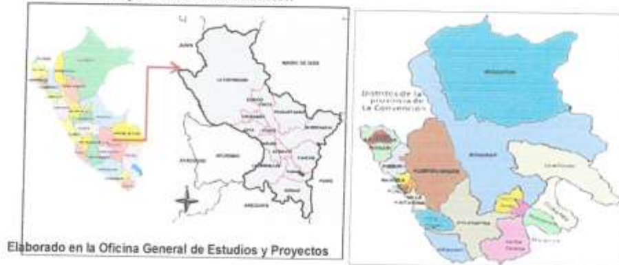
Mapa 1. Macro localización

Elaborado en la Oficina General de Estudios y Proyectos