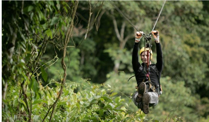
Imagen referencial de la experiencia