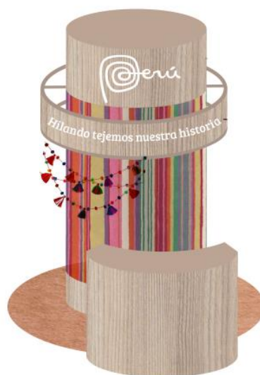
Imagen referencial de lo requerido