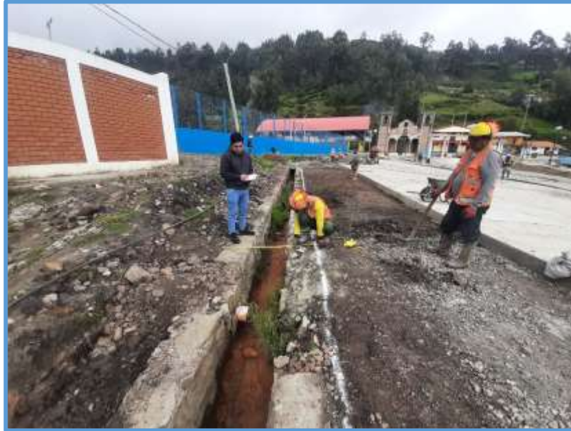
Foto 01: Se ve el Canal Principal en mal estado, además la llegada de drenaje del inicial.

DENOMINADO: "MANTENIMIENTO DEL CANAL EN LA LOCALIDAD DE AMPAS DEL CENTRO POBLADO DE AMPAS DEL DISTRITO DE HUARI, PROVINCIA DE HUARI, DEPARTAMENTO DE ANCASH"