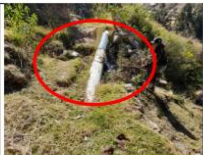
Fotografía N° 07: Tubería PVC rota, expuesta al medio ambiente.

Firmado digitalmente por CONDOPE RIVERA Edin PAL 20414965218 Perú Motivo: Day Voto Suero Fecha: 07-01-2025 16:56:58 -05:00