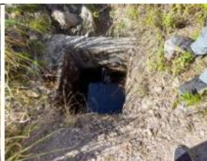
Fotografía N° 06: Toma lateral sin tapa y se observa rajaduras y existe filtración.