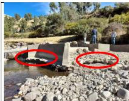
Fotografía N°01: Inicio Km 0+000, Bocatoma tipo Barraje se encuentra deteriorada por presentar socavación en la base.

Firmado digitalmente por: CRUZ HUANCHUQUI 41 986077 firm Motivo: Day Voto Sueldo Fecha: 07-01-2025 16:53:52 -05:00