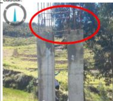
Fotografía N°04: Pases Aéreo falta colocar accesorios y tubería HDPE, acero utilizado está expuesto al medio y se encuentra oxidado.

Av. Alameda del Corregidor N°155 – La Molina T: (511) 424-4488 www.gob.pe/psi