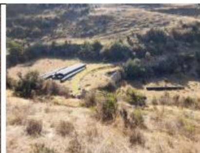
Fotografía N°12: Tubería HDPE abandonada.