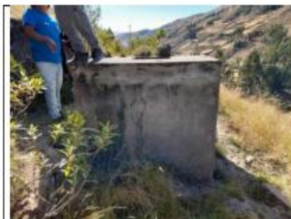
Fotografía N° 05: Cámara de Inspección sin tapas y con rajaduras.

"Decenio de la Igualdad de oportunidades para mujeres y hombres" "Año del bicentenario de la consolidación de nuestra independencia, y de la conmemoración de las heroicas batallas de Junín y Ayacucho"