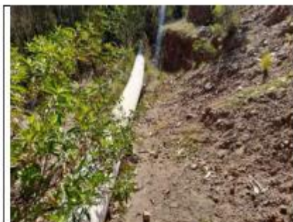
Fotografía N°11: Tubería PVC expuesta al medio ambiente.

"Año del bicentenario de la consolidación de nuestra independencia, y de la conmemoración de las heroicas batallas de Junín y Ayacucho"