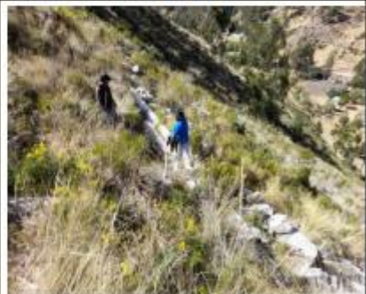
Fotografía N° 09: Tubería PVC expuesta al medio ambiente, sin empalmar.