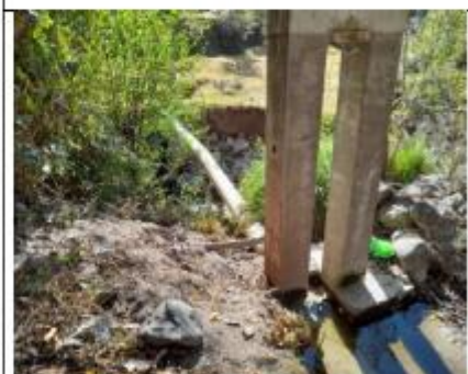
Fotografía N°03: Pases Aéreos de diferente Longitudes se encuentran inconclusa solamente con zapatas y columnas.