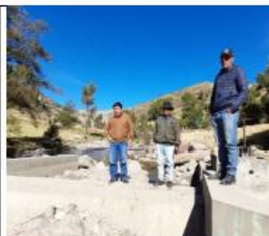
Fotografía N°02: Compuerta en mal estado, el sedimentador esta arenado y no tiene compuerta reguladora de ingreso de caudal.