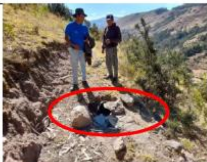
Fotografía N° 08: Tubería PVC rota.