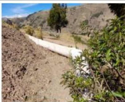
Fotografía N° 10: Tubería PVC expuesta al medio ambiente.

Firmado digitalmente por: CRUZ HUANACHO JULIO P. 41 986277 Perú Motivo: Day Voto Suero Fecha: 07-01-2025 16:53:52 -05:00