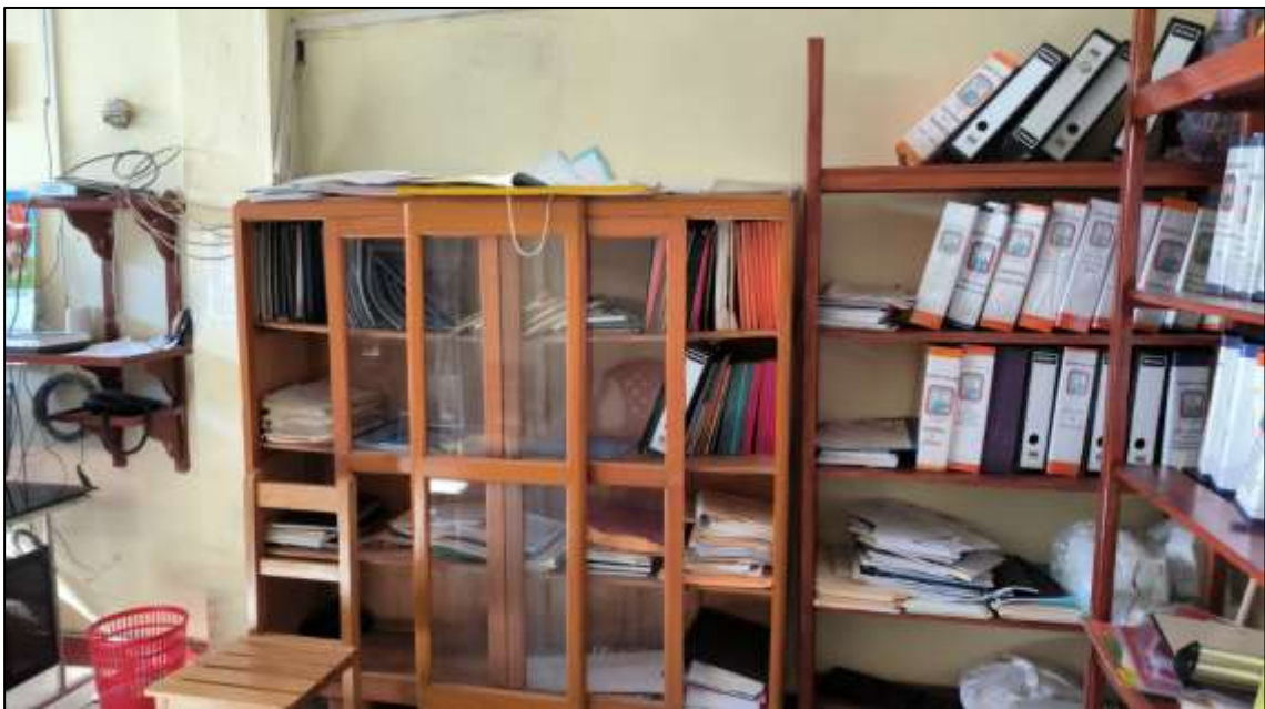
Imagen 07: Se observa ambientes en condiciones precarias, sin el mobiliario