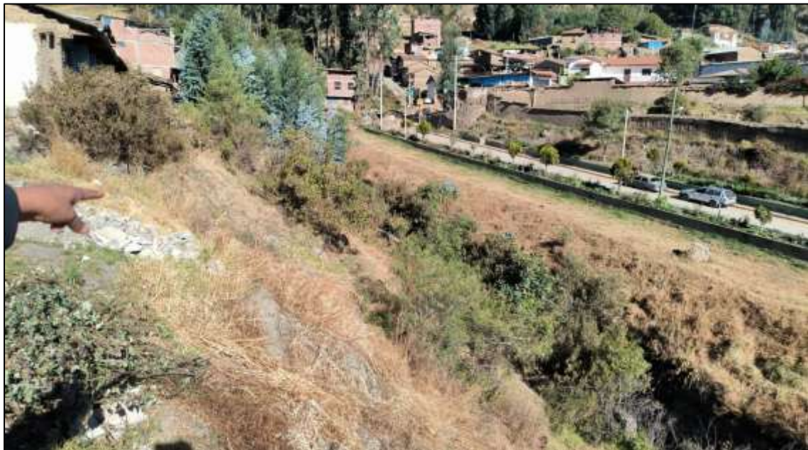
Imagen 02: Se aprecia que el lindero en la parte norte del predio colinda con el Rio

Vira, el cual cuenta con un muro de protección de condiciones precarias, además se requiere la protección de lindero del terreno para evitar ingresos a personas ajenas ala institución.