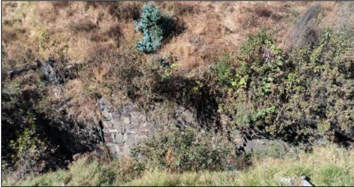
Imagen 03: Se aprecia que el muro de protección de material concreto ciclópeo, se encuentra desgastado e inclinado por la fuerza de empuje del talud.