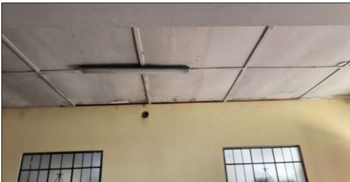
humedad y filtraciones.