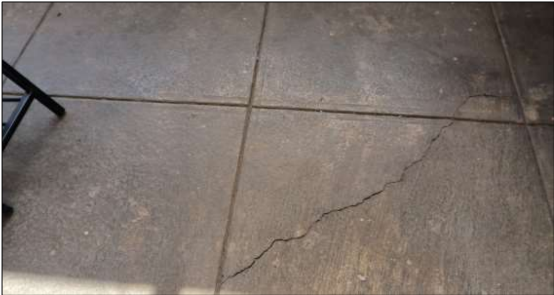
Imagen 07: Se observa el piso con presencia de grietas producto del asentamiento del suelo y cimientos.