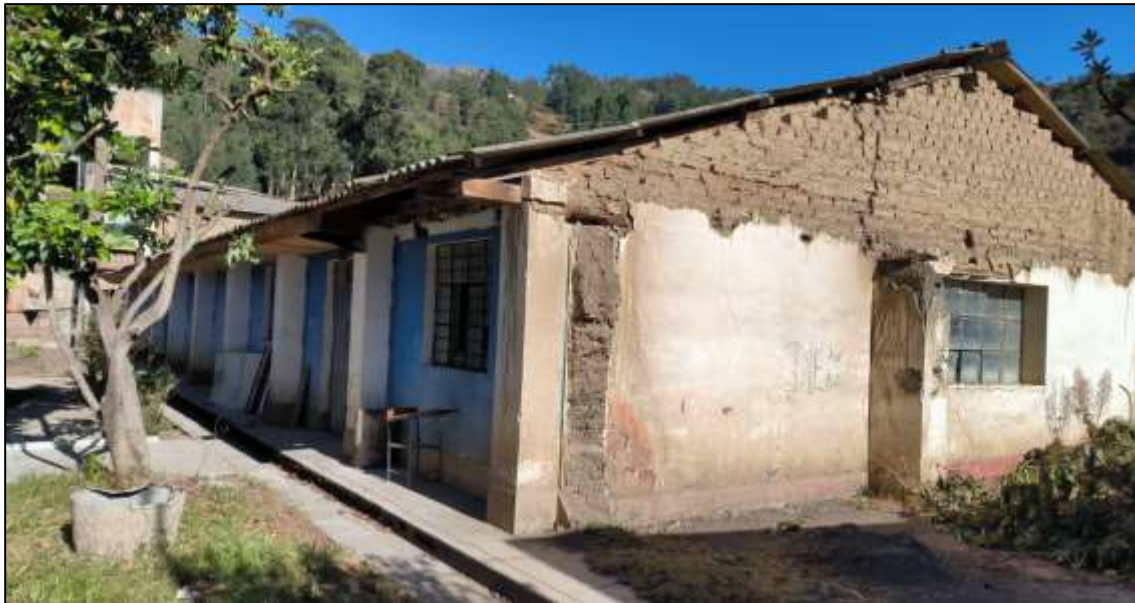
Imagen 05: Se observa que los ambientes usados por los alumnos son de adobe, en peligro de derrumbe, sin sistema antisísmico y antiguos del año 1985.