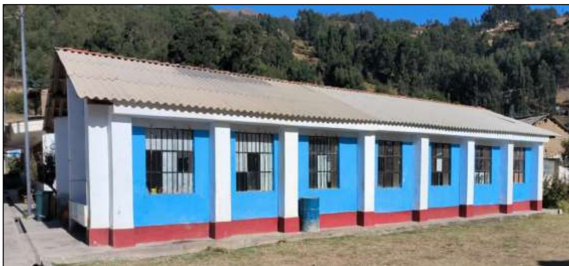
Imagen 08: Se observa los módulos antiguos con estructuras de Adobe.

En este sentido es prioridad para el Gobierno Regional de Ancash, intervenir en esta necesidad a fin de cerrar las brechas de calidad educativa de acuerdo a la Programación Multianual de Inversiones 2025 -2027 del GRA.