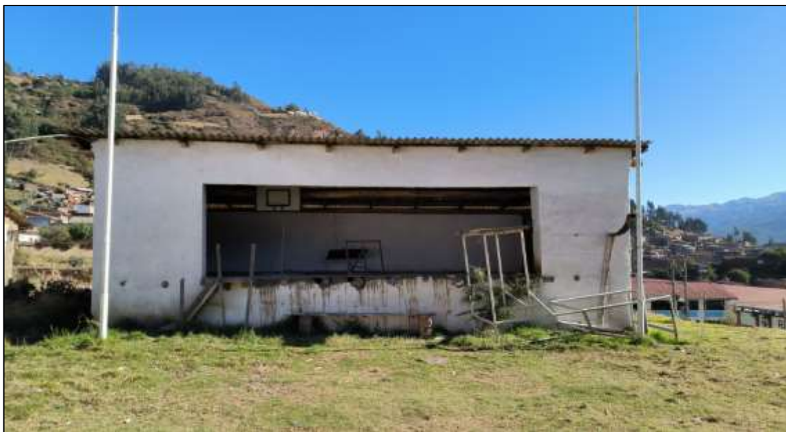
Imagen 04: Se aprecia estructura de adobe precaria en proceso de derrumbe por la antigüedad, este módulo fue adecuado para uso de escenario.