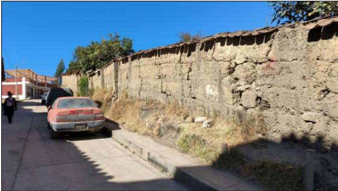
Imagen 01: Se aprecia el cerco de protección realizado con material rustico en malas condiciones con peligro de caer.

Imagen 02: Se aprecia que el lindero en la parte norte del predio colinda con el Rio