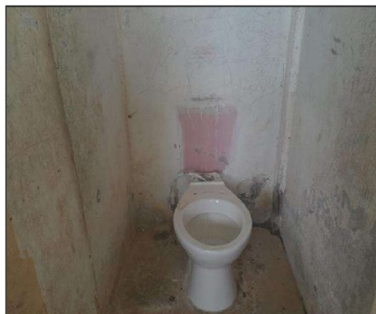
Vista de los SS.HH Existentes de la II.EE N° 60528