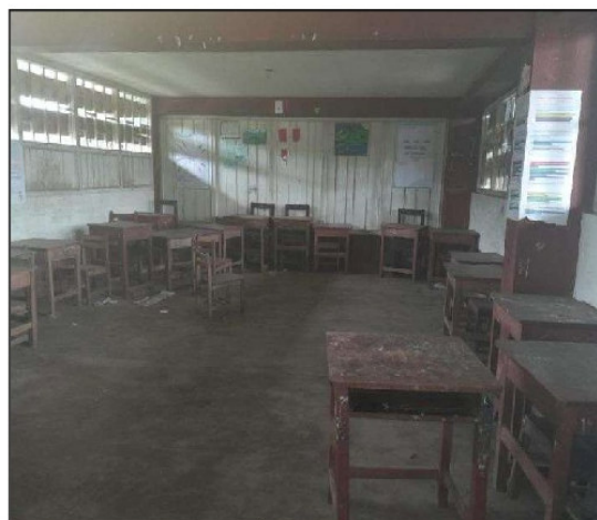
Vista de los Mobiliarios Existentes de la II.EE N° 60528