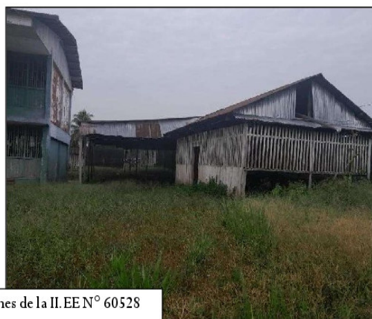
Vista Panorámica de las Edificaciones de la II.EE N° 60528