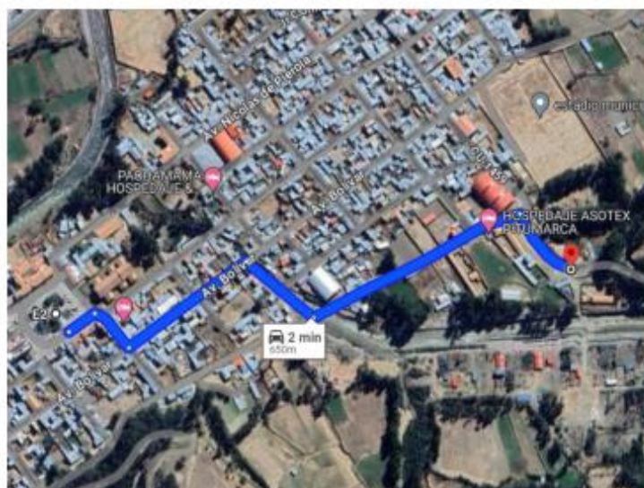
Imagen 01: Referencia de lugar de entrega.