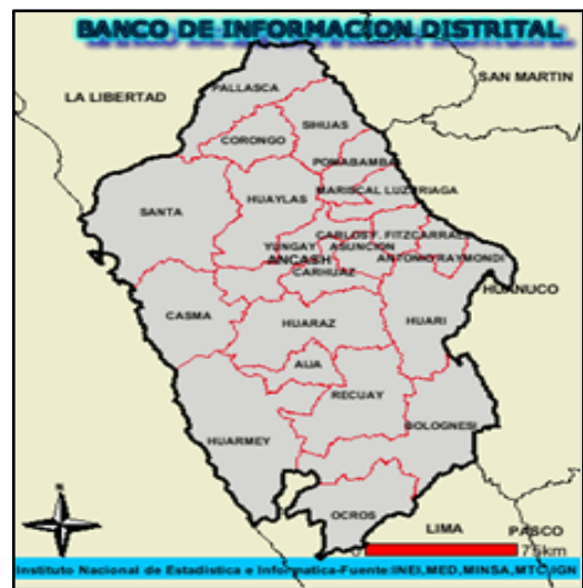
Departamento de Ancash