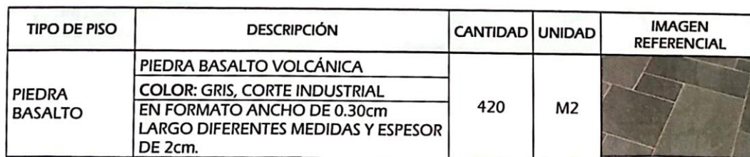
Imagen 2: DESCRIPCIÓN DE PISO -PIEDRA BASALTO