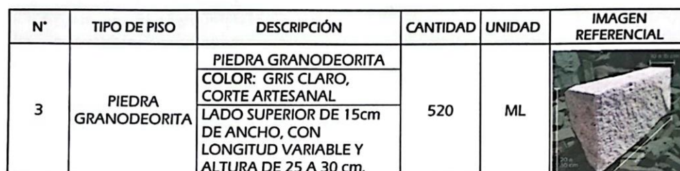
imagen 3: DESCRIPCIÓN DE PISO-PIEDRA GRANODIORITA